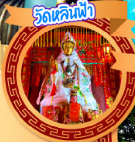
เจ้าแม่ทวนอิม วัดลี้ตบชี่