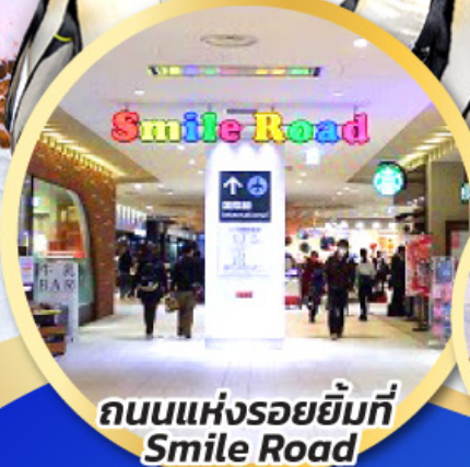
ถนนแห่งรอยยิ้มที่ Smile Road