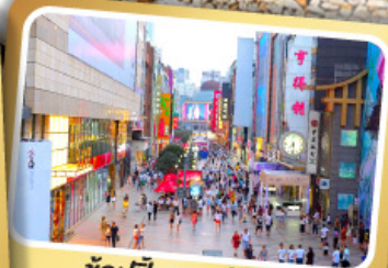
ช้อปปิ้งถนนซีลชีลู