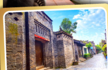
ถนนคนเดินชอยกว้างชวยแคบ