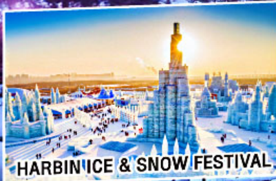
HARBIN ICE & SNOW FESTIVAL