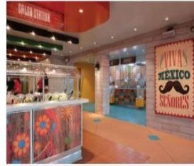
EL LOCO FRESH