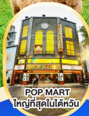
POP MART ใหญ่ที่สุดในไต้หวัน