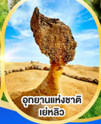
อุทยานแห่งชาติ เย่หลิว