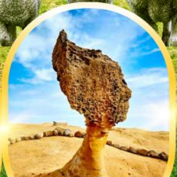
อุทยานแห่งชาติ เย่หลิว