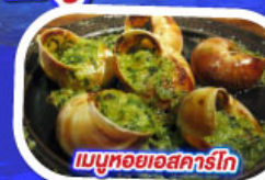
เมนูหอยแอสคาร์โก