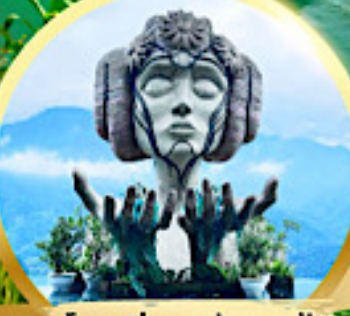
โมอาน่า ซาปา คาเฟ่