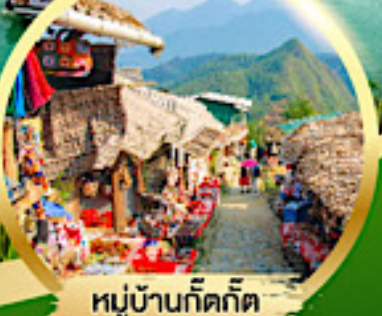
หมู่บ้านก๊ตก๊ต