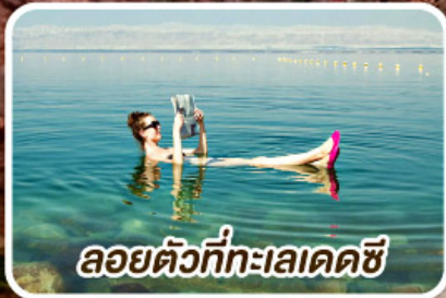
ลอยตัวที่ทะเลเดดซี