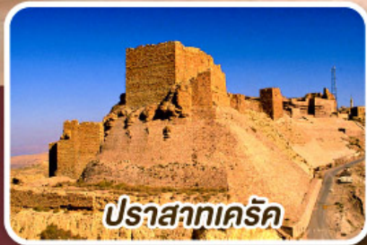
ปราสาทเคิร์ค