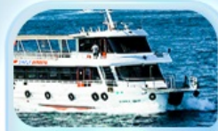
ล่องเรือ ช่องแคบบอสฟอรัส