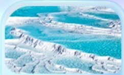
ปราสาทปูยผ้าย