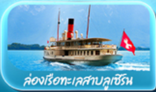
คองเรือทะเลสาบลูเซิร์น

ซูริก โลซาน เวเวย์ เซอร์แมท ลูเซิร์น ริกิ