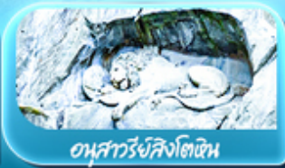
อนุสาวรีย์สิงโตหิน