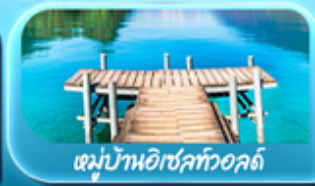
หมู่บ้านอิเชิลทอลล์