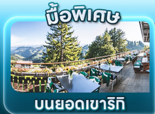
ข้อพิเศษ