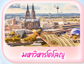
มทาวหารโคโลญ