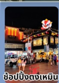
ช้อปปิ้งตงเหมิน