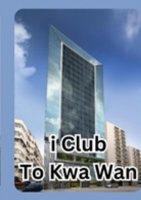
i Club To Kwa Wan

คอนเฟิร์มเดินทาง พฤศจิกายน 2567 2-4 / 9-11 / 16-18 23-25 / 30 พ.ย. - 2 ธ.ค.