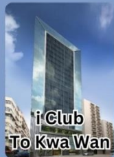
i Club To Kwa Wan