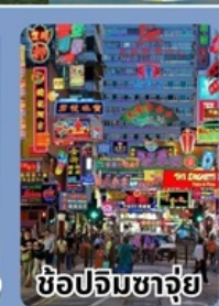
ช้อปปิ้งจว๋ย