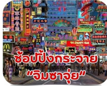
ช้อปปิ้งกระจาย "จิมซาจุ่ย"