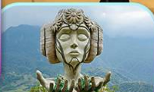
Moana Sapa Cafe