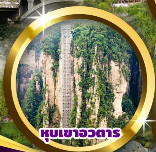
หุบเขาวตาร