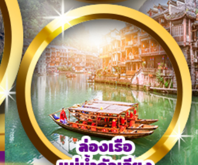
ล่องเรือ แม่น้ำฉางเจียง