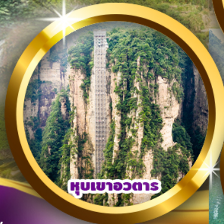
หุบเขาวงตार