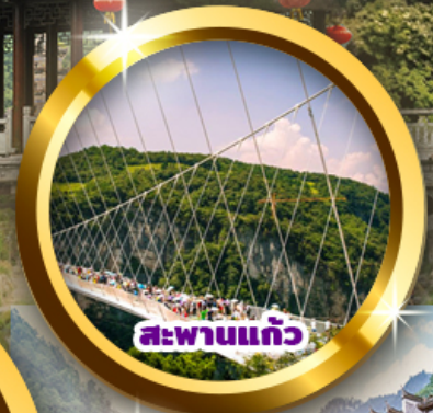
สะพานแกว้