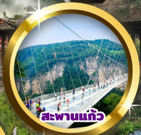
สะพานแก้ว