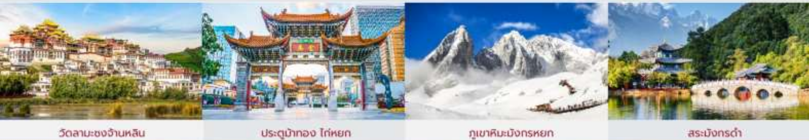
วัดลามะชงจ้านหลิน