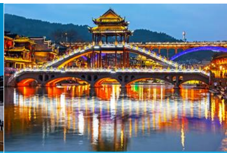
สะพานหวงเจียว