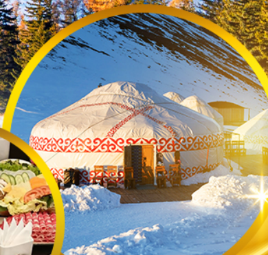
พักแคมป์ส่วนตัว