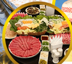
สุกัมองโกล