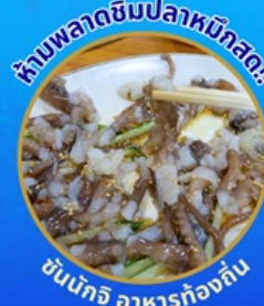
ห้ามพลาดชิมปลาหมึกสด!

โพล้งสเปซวอล์ค สกายวอร์ค ตามรอยซีรีส์ Hometown chachacha ถ่ายรูปชิคๆ หมู่บ้านวัฒนธรรมคัมซอน ขึ้นเคเบิลคาร์ ชมทะเลปูซาน นั่งรถไฟปูคปิก sky capsule ชิมของอร่อยตลาดแฮนแด อิสระช้อปปิ้ง Lotte Duty Free