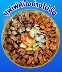
บุฟเฟ่ต์ปิ้งย่างไม่อั้น