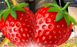
มีผลตอบเอบอจ้สุด ๆ จากรั้