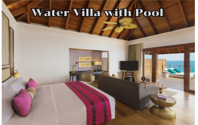
Water Villa with Pool