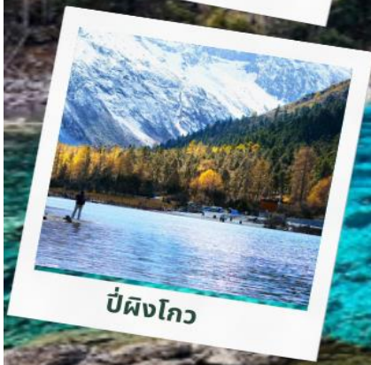
ปี่ผิงโกว