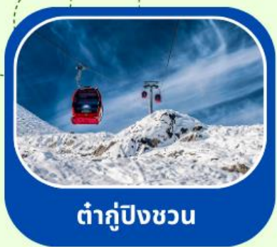
ต้ากู่ปิงชวณ