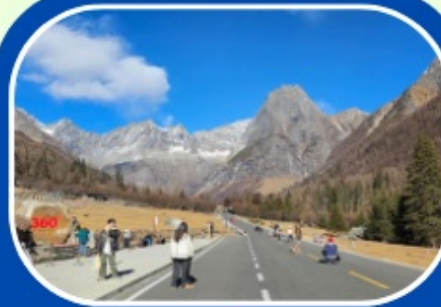
ภูเขาสี่ดรุณี