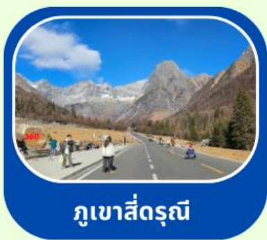
กุเขาสี่ดรุณี