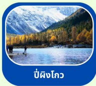
ปี่ผิงโกว