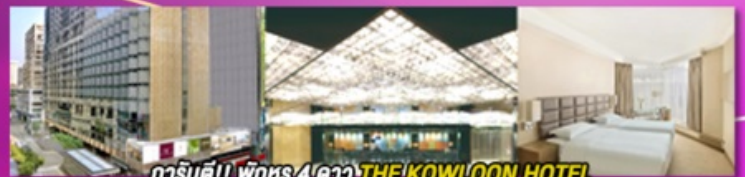
การ์นต์!! พิเศษ 4 ดาว THE KOWLOON HOTEL ติดถนนนาธาน ย่านช้อปปิ้งจิมซาจู้