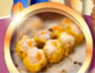
ติ่มซำต้นตำรับ