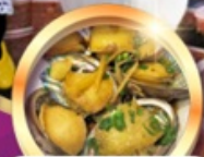
เมนูซีฟู้ดพรีเมียม