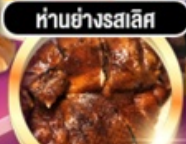
ห่านย่างรสเลิศ