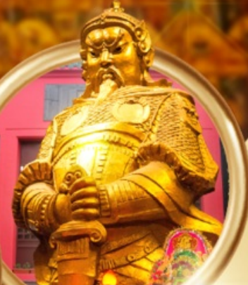
ทำอย่างรสเลิศ