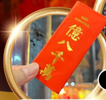
ยืมเงินเจ้าแม่กวนอิม