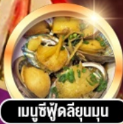
เมนูซีฟู้ดลิ้นจี่