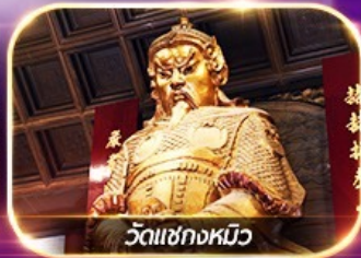
วัดเชกงหวี