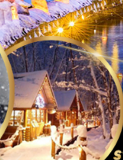
หมู่บ้านเทพนิยาย นิงเกิลเทอเรส