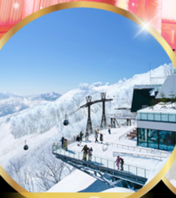
จุดชมวิวก Unkai Terrace