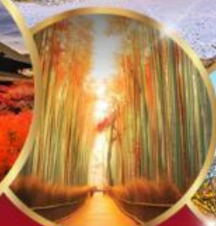
ป่าไผ่ อาราชิยาม่า