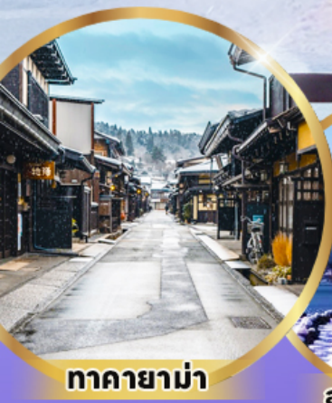
ตากายาม่า