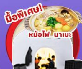
มือพิเศษ!

45,919 ราคา เดียว บาท รวมภาษีมูลค่าเพิ่ม 7%