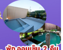
พัก ออนเซ็น 2 คืน