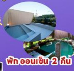
พักออนเซ็น 2 คืน