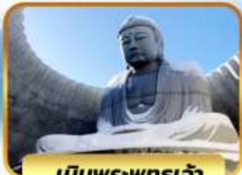
เนินพระพุทธรเจ้า