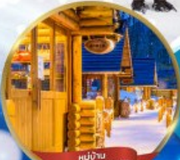
หมู่บ้าน NINGLE TERRACE

สนุกสนาน ณ ลานสกี • หมู่บ้านราเมนอาซาฮิคาว่า • หมู่บ้านนิงเกิลเทอร์เรส ขบวนพาเหรดเพนกวิน ณ สวนสัตว์อาซาฮิคาว่า • โรงงานช็อกโกแลต โอตารุ • ศาลเจ้าฮอกไกโด • พระใหญ่ HILL OF BUDDHA