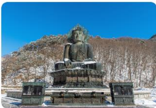
แห่งนี้ได้

อุทยานแห่งชาติแห่งเทือกเขาชอรัค เป็นหนึ่งในสถานที่ท่องเที่ยวทางธรรมชาติที่มีชื่อเสียงที่สุดของเกาหลีใต้ เทือกเขาที่ทอดตัวยาวไปตามเมืองต่าง ๆ ครอบคลุมอาณาบริเวณของเมืองชกโซ โกซอง อินเจ และยังยาง ในจังหวัดคังวอน ได้รับการกำหนดให้เป็นอุทยานแห่งชาติแห่งที่ห้าของเกาหลีใต้เมื่อปี ค.ศ. 1970 และยังเป็นเขตสงวนชีวมณฑลของโลก โดยองค์การยูเนสโกเมื่อปี ค.ศ. 1982 อุทยานแห่งนี้มีพื้นที่รวม 398 ตารางกิโลเมตร เนื่องจากยอดเขาของเทือกเขาแห่งนี้ถูกปกคลุมไปด้วยหิมะเป็นเวลา 5 – 6 เดือนของปี ที่นี้จึงถูกเรียกว่า “ชอรัค” ซึ่งหมายถึงยอดเขาที่เต็มไปด้วยหิมะ และยังมียอดเขาอื่น ๆ อีก 30 ยอด เช่น โซซงบง ฮวาแซบง และจุงซงบง ที่เต็มไปด้วยทิวทัศน์อันงดงาม รวมถึงน้ำตกและถ้ำอีกหลายแห่งที่อยู่ในอุทยานแห่งนี้ ที่อุทยานยังมีการบริการขึ้นสู่ยอดเขาด้วยกระเช้าไฟฟ้า ทั้งนี้เพื่ออำนวยความสะดวกสำหรับผู้พิการและผู้สูงอายุ เพื่อให้ทุกคนสามารถขึ้นไปบนยอดเขา ทศนาอย่างเพลิดเพลินกับทัศนียภาพอันงดงามของ “ชอรัคซาน”