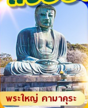
พระใหญ่ คามาคุระ