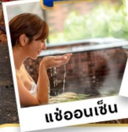
แฮ่อนเซ็น