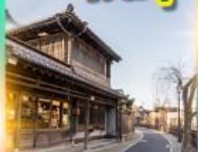
เมืองเก่าซาวาระ