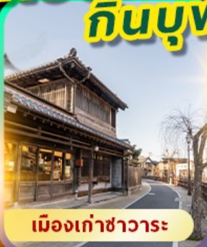
เมืองเก่าซาวาระ