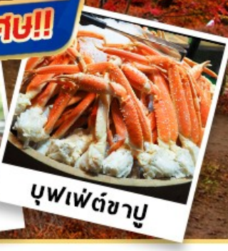
บุฟเฟ่ต์ชาบู