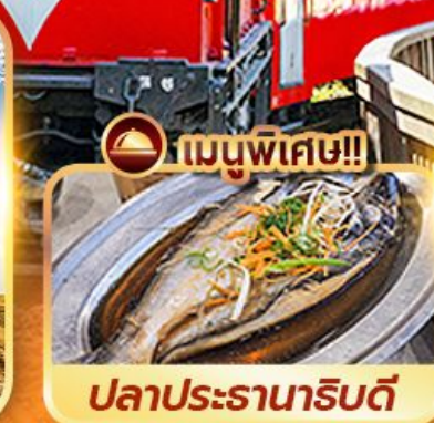
ปลาประดานาธิบดี