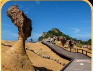
อุทยานหินเหย์หลิว