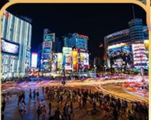
ย่านซีเหมินติง