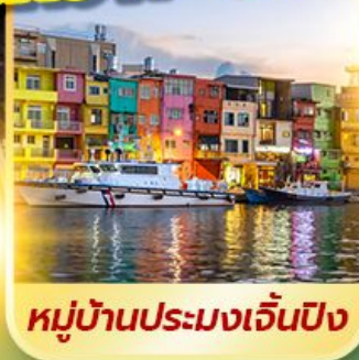
หมู่บ้านประมงเจิ้นปิง