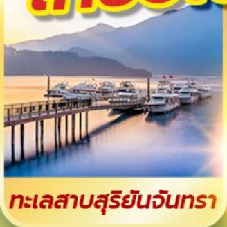
ทะเลสาบสุริยอันจันทร์