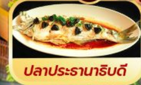
ปลาประรานาธิบดี