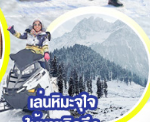
เล่นหิมะ-จาว ให้หายคิดถึง