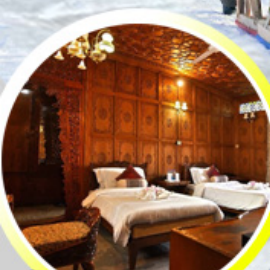
บ้านเรือ..วิมานบนดิน