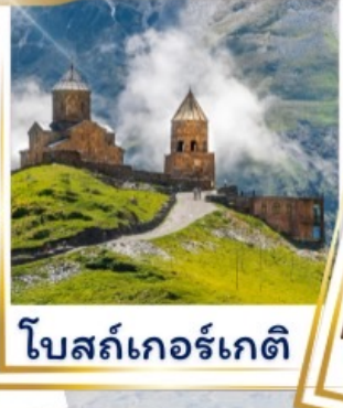
โบสถ์เกอร์เกติ