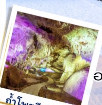
ถ้ำไฟรมีเทียส