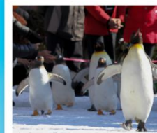
สวนสัตว์นิกเซ่

วัดคิตสึโอจิ / ปราสาทโอซาก้า / ย่านชินไซบาชิ ค่องเรือทะเลสาบโทยะ / โทริยวคะกุ ทาวเวอร์ โกดังอิฐแดงคานโมริ / นั่งกระเช้าภูเขาฮาโกดาเตะ ตลาดเช้าเมืองฮาโกดาเตะ / สวนสัตว์นิกเซ่ มารีนพาร์ค พิพิธภัณฑ์กล่องดนตรี / นาฬิกาไอน้ำโบราณ โรงเป่าแก้วคิตาอิชิ / เนินพระพุทธรเจ้า / มิซึย เอ้าเค็ทท์