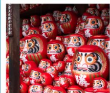
วัดคิตสึโอจิ