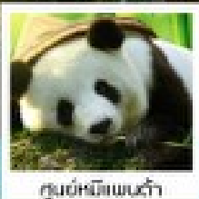
ศูนย์อนุรักษ์แพนด้า