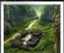
อุทยานฝยริ หนานเฉิงต๋องต๋อง