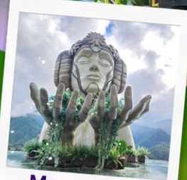
Moana Cafe Sapa