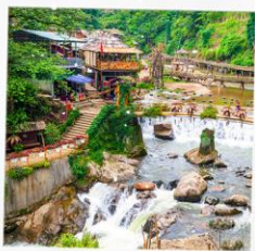
หมู่บ้านกิตกิต