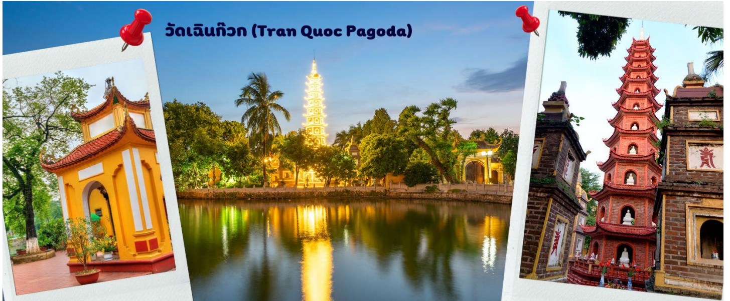
วัดเงินทิว (Tran Quoc Pagoda)

พระพุทธศาสนา จากภาพมุมสูงของสถานที่ตั้ง ที่นี่เหมือนตั้งอยู่บนเกาะที่ยื่นลงไปในทะเลสาบ แต่มีเส้นทางคมนาคมเข้าถึงที่ สิ่งปลูกสร้างมีการวางผังเป็นอย่างดี ใช้สีสันทึกลมกลืนในโทนสีเหลือง น้ำตาล ตัดกับสีเขียวของต้นไม้ใหญ่ที่โอบล้อมอยู่ ในมุมถ่ายภาพจากอีกฝั่งหนึ่ง จะเห็นสิ่งปลูกสร้างสไตล์จีน และเจดีย์หลายชั้นโดดเด่น มีภาพที่สะท้อนลงสู่ผิวน้ำ เป็นภูมิทัศน์ที่งดงามทั้งยามกลางวันและยามค่ำคืนที่มีการเปิดไฟส่องสว่าง