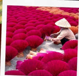
หมู่บ้านรูป