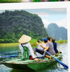
ล่องเรือ Tamcoc