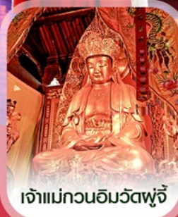
เจ้าแม่กวนอิมวัดฟูจี้