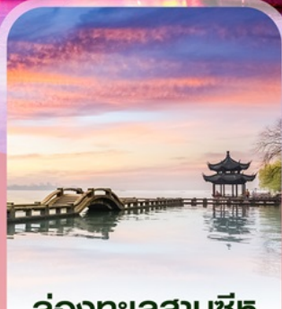
ล่องทะเลสาบซีหู