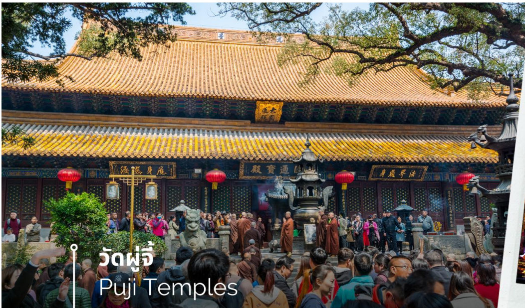
วัดฝูจี้ Puji Temples

นำท่านสู่ วัดฝูจี้ วัดในตำนานที่ควรมาเป็นอย่างยิ่ง โดยไฮไลท์ของวัดนี้คือ องค์พระโพธิสัตว์ที่มีเทพลักษณะเป็นชาย เป็นองค์ที่ชาวจีนทั่วโลกให้ความเลื่อมใสศรัทธาสูงสุด ซึ่งวัดฝูจี้เนี่ย เป็นวัดใหญ่ที่สุดบนเกาะที่มีประวัติเก่าแก่นับพันปี แต่เดิมเนี่ยเป็นวัดเล็ก แต่ผ่านร้อนผ่านหนาวมา ตั้งแต่ยุคราชวงศ์ซ่ง หยวน หมิง และชิง จนกระทั่งได้รับพระราชทานนาม “ฝูจี้” จากจักรพรรดิคังซีแห่งราชวงศ์ชิง ส่วนในรัชสมัยของจักรพรรดิหย่งเจิ้นก็ได้รับการบูรณะครั้งใหญ่จนกลายเป็นวัดที่มีขนาดใหญ่และสำคัญที่สุดบนเกาะ ภายในมีพื้นที่กว้างขวาง มีสถาปัตยกรรมวิจิตรงดงามมากมาย