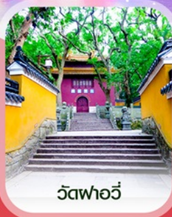
วัดฟอวี่