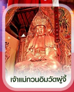
เจ้าแม่กวนอิมวัดโพธิ์

คอนเฟิร์มออกเดินทาง ทุกปีเร็ว 2 ท่านขึ้นไป