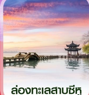
ล่องทะเลสาบซีหู