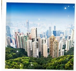
จุดชมวิวเขาวิกตอเรีย