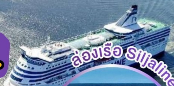
ล่องเรือ Siljeline