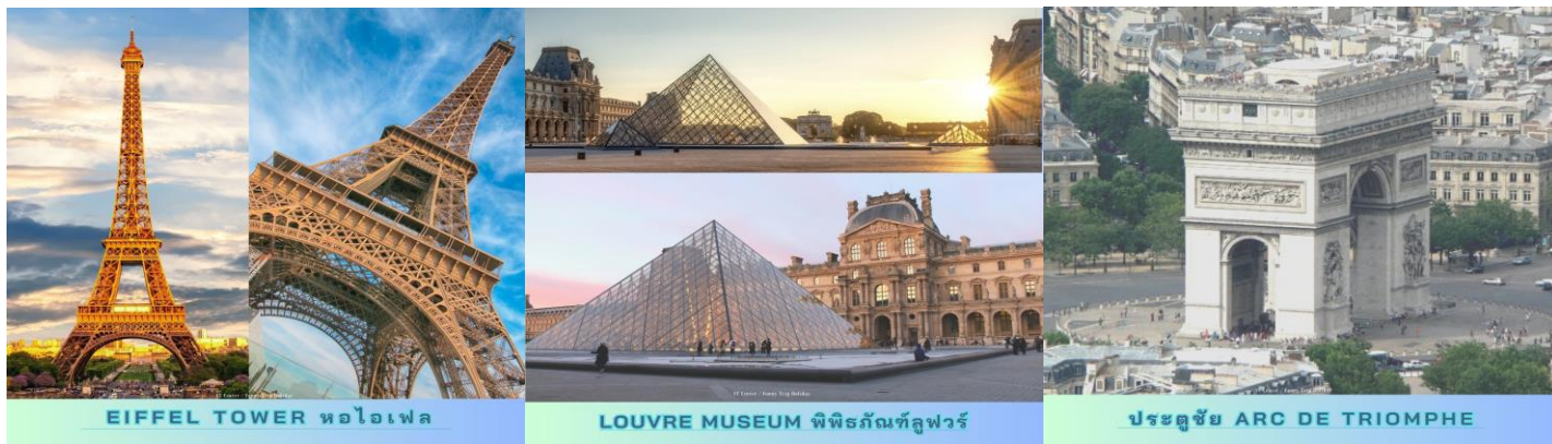
EIFFEL TOWER หอไอเฟล