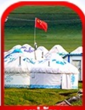
หมู่บ้าน พื้นเมือง